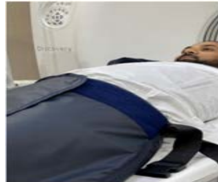
وسائل الحماية والوقاية أثناء تصوير الأشعة المقطعية

● يتم استخدام وسائل الحماية والوقاية المناسبة أثناء تصوير الأشعة المقطعية بشكل مناسب اعتمادًا على النوع والمنطقة التي أشار إليها طبيبك فقط، وذلك لتقليل نسبة التعرض الإشعاعي لأجزاء الأخرى من الجسم.